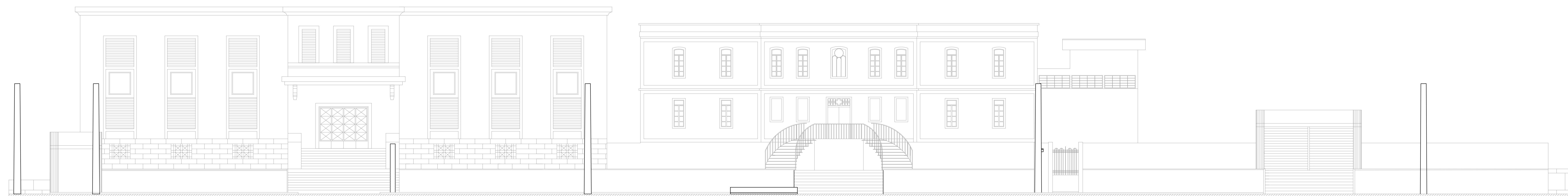
FACHADA - RUA SÃO BENTO Escala 1:100